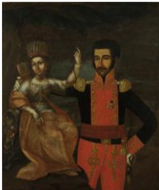
Bolívar y la América india Pedro José Figueroa Siglo XIX Óleo sobre tela Registro: 03-076

Un Libertador agresivo, luchador y guerrero es referenciado con lo indígena, lo criollo, lo americano, pero cuando se trata de costumbres, de pensamientos y aficiones se habla de lo europeo. En ese caso, tiene descendencia vasca, castellana y andaluza cuando se argumenta su noble cuna y distinguida crianza. Inclusive por algunas de sus características físicas como sus labios gruesos, su pelo crespo, sus pómulos salientes, entre otros, se rumoró con estudios imprecisos una posible mezcla de sangre negra. Pues en cuanto a su tez, el libertador era blanco desde pequeño, pero su color de piel clara se transformó en una tez más trigueña por su exposición constante al sol y la viento.